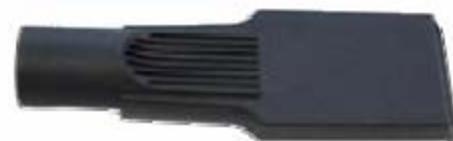
Lancia piatta “America – “America” crevice

Powerful vacuum cleaners (4 Hp), small sizes, ideal for car cleaning. Standard accessories include 5 m flex hose and type “America” crevice, with a 80 litres tank for model S and 50 litres for model SS. Last model is equipped with a manual filter shaker.